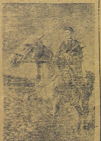
На снимке: Два дня назад корпуса генерал-лейтенанта Кариченко П.Г. Камнев.

Сводка принята по радио полностью из-за перерыва в работе электростанции.