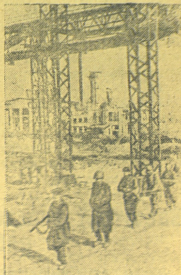
На снимке: Отделение бойцов рабочего батальона одного из заводов, защищающих родное предприятие.