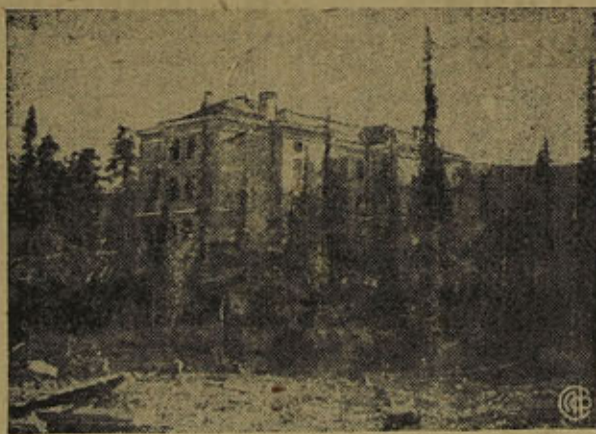
На снимке: новая школа на 400 человек учащихся построена в течение 3 месяцев.