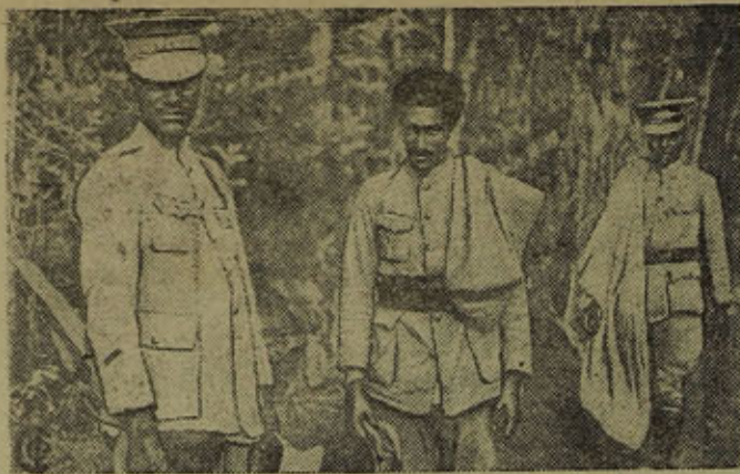
Итало-абиссинская война. НА СНИМКЕ: Абиссинские солдаты в Дессие.

Участники кино-фестиваля колхозной молодежи просматривают лучшие звуковые фильмы: — «Чапаев», «Крестьяне», «Юность Максима», «Вражья тропа» и др.