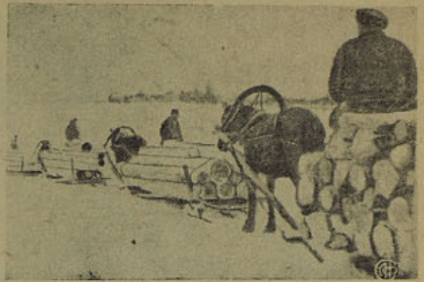
НА СНИМКЕ: Вывозна древесины по снежной улучшенной дороге. Бр. Краснопольские — колхоз „Искра“ — при норме 4,2 куб. вывозят до 17 куб.