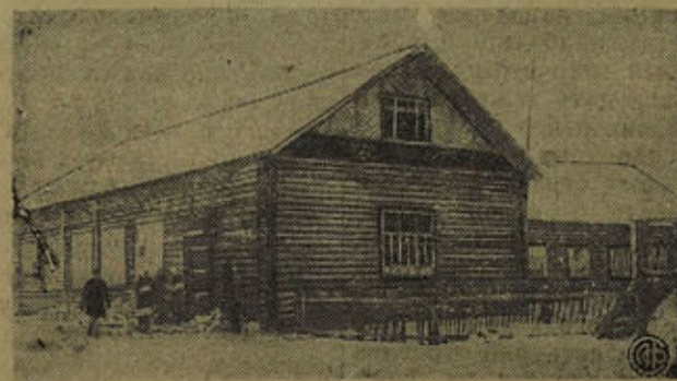
В колхозе «Путь к социализму» Надуйского района закончена постройка нового клуба на 500 человек. На снимке: внешний вид клуба.