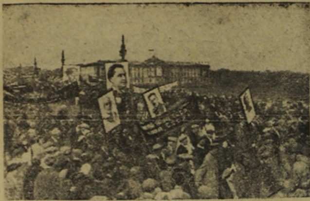
На снимке: Колонны демонстрантов.