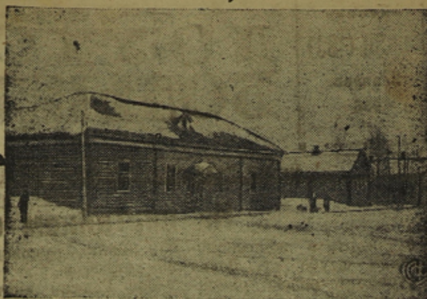
На сн. Улице колхоза „ПАХАРЬ“ — слева — колхозный клуб.