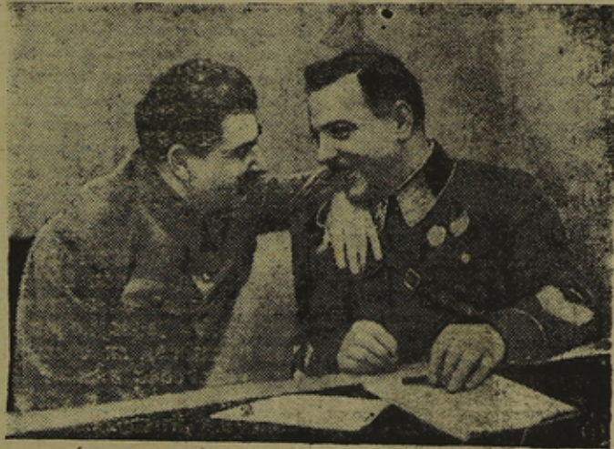
И. В. Сталин и К. Е. Ворошилов. (На совещании передовых колхозников и колхозниц Узбекистана, Казахстана и Кара Калпаки с руководителями партии и правительства).

Первая и основная особенность нашей Красной армии состоит в том, что она есть армия освобожденных рабочих и крестьян Октябрьской революции, армия диктатуры пролетариата. Все до сих пор существовавшие армии, какой бы они ни имели состав, являются армиями утверждения власти капитала. Они были и остались армиями господства капитала. Буржуа всех стран лгут, когда говорят, что армия политически нейтральна. Не верно это. В буржуазных государствах армия лишена политических прав, она отстранена от политической арены, это верно. Но это вовсе не значит, что она нейтральна политически. Наоборот, всегда и везде, во всех капиталистических странах армия вовлекалась