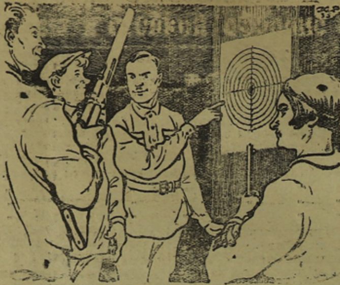
Попадание отличной! Точку мы поставим на всяком покушении на нашу родину. (Рис. Елисева.)