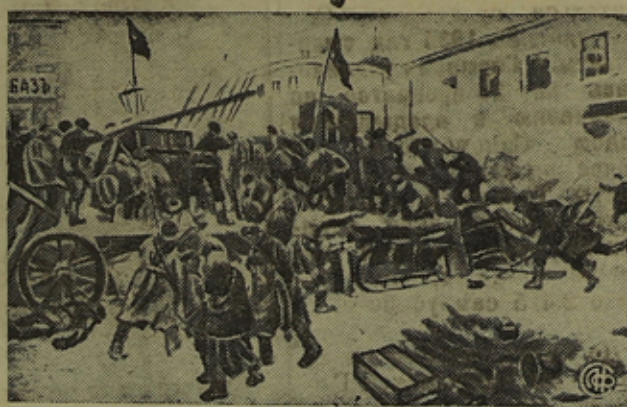
На снимке: Бой на баррикадах. (С картины художника Владимиров)

ДЕКАБРЬСКОЕ ВООРУЖЕННОЕ ВОССТАНИЕ В МОСКВЕ (1905 г.)