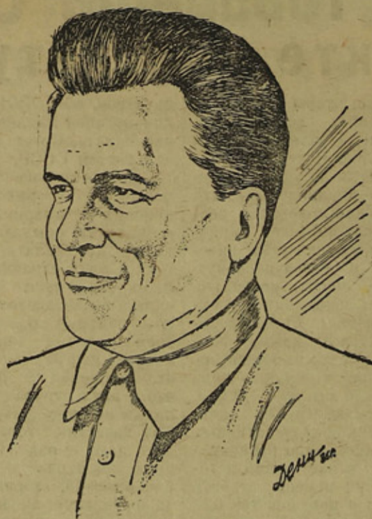
1—го декабря 1934 года в Ленинграде от злодейской руки Николаева, — густного убийцы, подосланного троцкистско—зюновьевской бандой подлых реставраторов капитализма, пал пламенный революционер большевик товарищ Сергей Миронович Киров Портрет С. М. Кирова