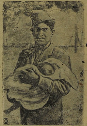
На снимке боец рабочей милиции с ребенком, которого он вынес из под огня самолетов мятежников бомбардировавших селение Сиерро мульяно.