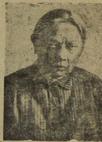
26 февраля исполнилось 67 лет со дня рождения ближайшего друга и помощника Ленина — Надежды Константиновны Крупской.