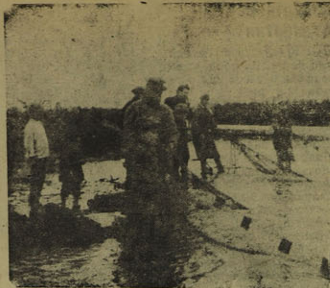
На Рыбной ловле

Руководителям бумфабрики и поселковому совету надо позаботиться о ремонте ясель заблаговременно.