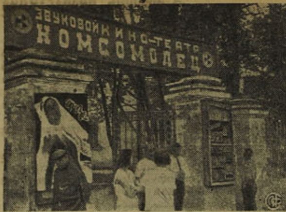
В г. Тихвине открылся звуковой кино театр. На сн.: У кино-театра.