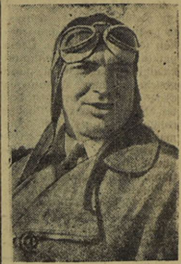
НА СНИМКЕ: Герой Советского Союза летчик-испытатель орденоносцев тов. Чкалов.