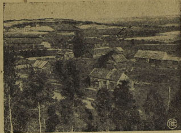
НА СНИМКЕ: Общий вид строящегося районного центра Шугозеро