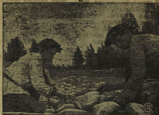
НА СНИМКЕ: Постройка новой трассы у поселка Полише.