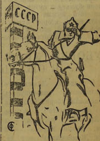
Sovettimaan rajat ovat huolellisesti vartioituidut.