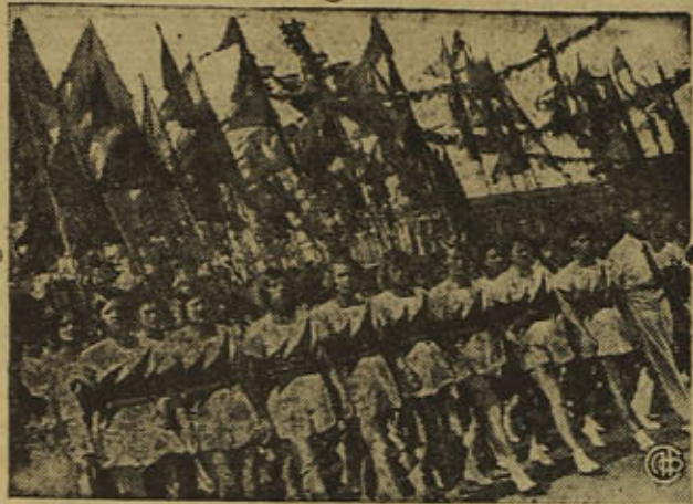
Kuvassa: Paradiin osallistujista Leningradin urheilijoista.