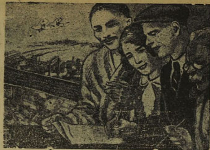
Toien viisivuotisen (neljännen vuoden) lainan menestyksellisellä sijoittamisella turvaamme kaikkien kansojen hyvinvoinnin ja kulttuurin edelleen kohoamisen.

Tokio 6. VII. (Tass) Domei Zusin tiedottaa uusista kapinoista Nankingin sotajoukoissa, jotka mobilisoi-tiin luoteiselle rintamalle. Esimerkiksi Gluitzhouun maakunnan sotajoukot kieltäytyivät täyttämästä Nankingin antamaa määräystä sotajoukkojen toiselle paikkakunnalle siirtämisestä. Huansinin neljänteen armeijaan kuuluvat sotajoukot nousivat kapinaan Nankingin viranomaisia vastaan ja suuntautuivat Hunaniin ja Huansen maakuntien rajalle yhdistyäkseen Huansinin armeijaan.