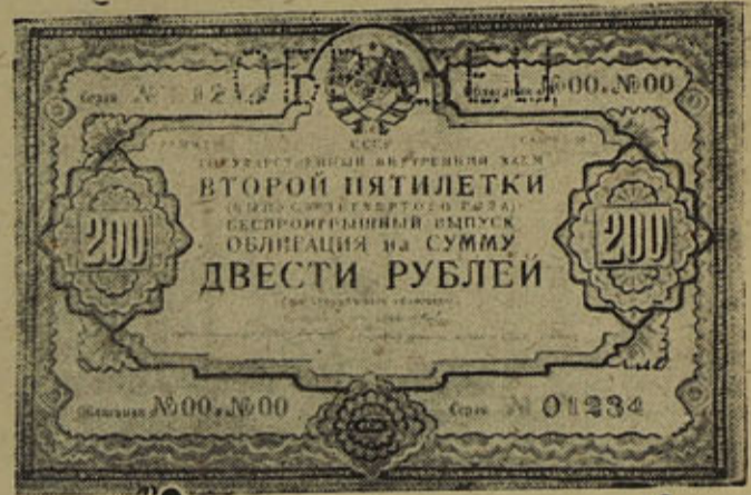
Toisen viisivuotisen (neljännen vuoden) lainan obligatioin näyte.