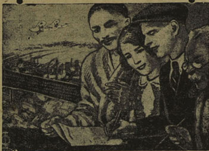
Рабочие и работницы! Инженерно-технические работники и служащие! дадим займа нашему Государству двух-трех недельный заработок! Подпиской на заем Второй Пятилетки (выпуск четвертого года) усилим мощь нашей цветущей, счастливой и непобедимой родины.

Слабо развывается работа по реализации займа на лесопунктах Кондопожского леспромхоза и других мелких организациях Кондопоги.