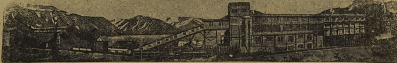
На средства от займов наше государство строит крупные предприятия

3. Поручить Народному Комиссариату Финансов Союза ССР организовать с 1 сентября 1936 года, в первую очередь в крупных городах, непосредственно на предприятиях, в учреждениях, сельских советах и колхозах обмен облигаций государственных займов, перечисленных в статье второй и закончить этот обмен в срок до 1 марта 1937 года с тем, чтобы лица, которые в этот срок не успели предъявить своих облигаций к обмену на облигации займа второй пятилетки (выпуска четвертого года), имели право предъявить их в сберегательные кассы для обмена до 1 сентября 1937 года, а облигации, не