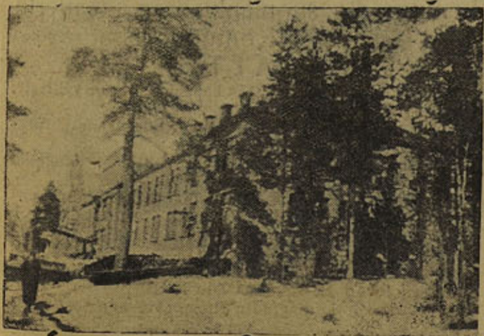
Средства от займов идут на строительство культурно-бытовых учреждений. НА СНИМКЕ: Новое здание районной больницы в Ковдопеге.

Отчисления от займовских средств на местные нужды составляют большие суммы. Это — десятки и сотни школ, амбулаторий, яслей, библиотек, многие километры новых дорог.