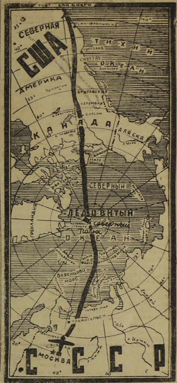
Июля 14 пайвана тәвдү энзимәне годовщина замечательной истувдуматтоман леннон маршруттуа муь Москва—Северной полюса — Американ Соединной штатат Советскойн Союзан Геройлойн М. М. Громован, А. В. Юмашеван и С. А. Данилинен. Рисуналла. т. т. Громован, Юмашеван и Давилинан леннон маршрутной картта.