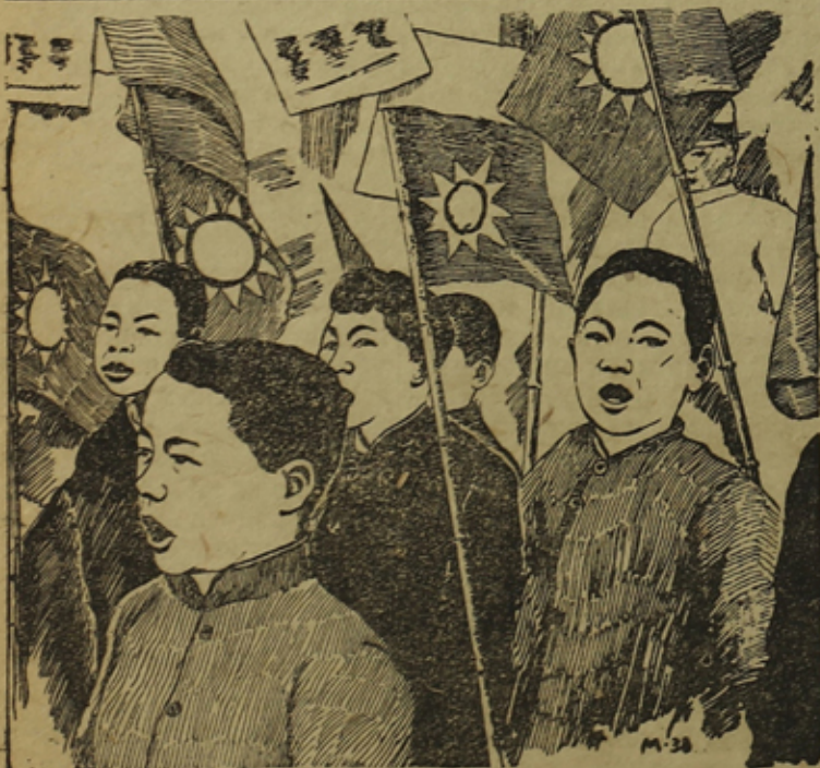
Китайской нуоризо антияпонскойлла демонстрациялла.