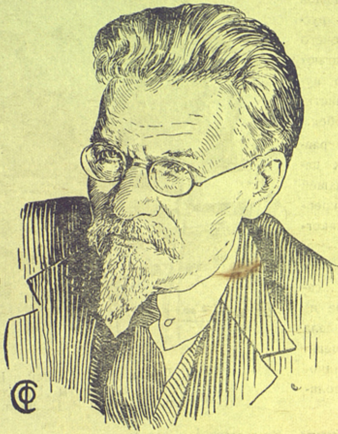
Михаил Иванович Калинин Председатель Президиума Верховного Совета СССР

Изложив соображения, которые по мнению Советов Старейшин должны быть положены в основу избрания