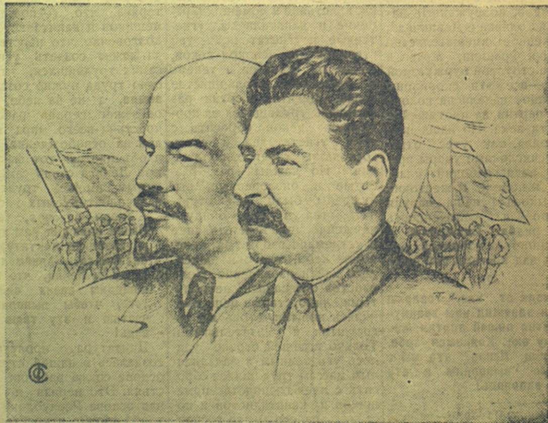
В. И. Ленин и И. В. Сталин (рисунок художника П. Васильева).