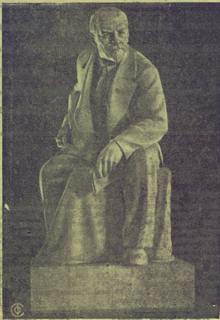
В. И. ЛЕНИН. Скульптура С. Меркурова.