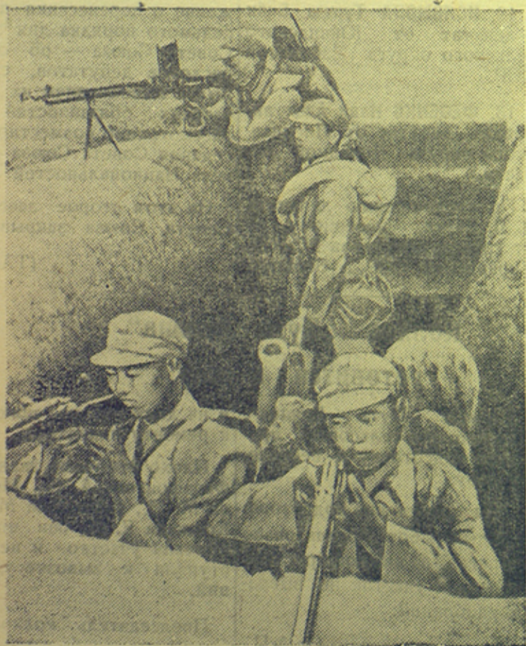
Китайские войска защищают захваченные у японцев позиции.

Все эти военные политические мероприятия несомненно окажут большое влияние на ход войны. (ТАСС).