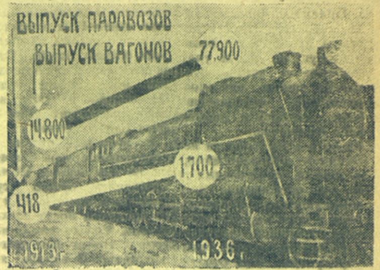
На снимке: Диаграмма выпуска паровозов и вагонов (готовые паровозы „ФД“ перед отпровкой с Ворошиловградского паровозостроительного завода).

Чудесные цифры социалистических побед. К выборам в Верховный Совет СССР наша Родина пришла мощной социалистической индустриальной страной.