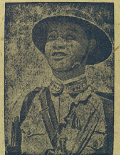
На снимке: Младший командир китайской армии.