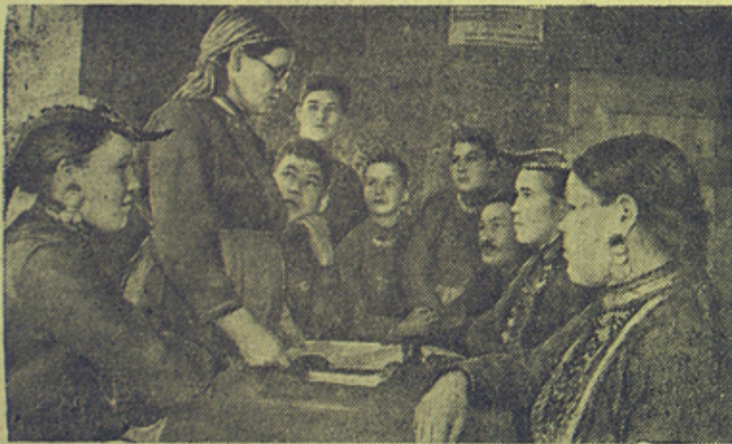
На снимке: Группа колхозников артели имени Кирова (Нижне-Сергинский район, Свердловская область) за изучением материалов XVIII съезда ВКП(б). Беседу проводит делегат съезда ВКП(б), председатель Старо-Бухаревского сельсовета М. П. Ухова (стоит).