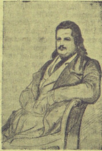
На снимке: Оноре Бальзак. С портрета работы Ф. Фогельштейна.

—заголовок грандиозной эпопеи, состоящей из многочисленных романов и повестей Бальзака, объединенных общим замыслом писателя: дать развернутую картину современного ему буржуазного общества.