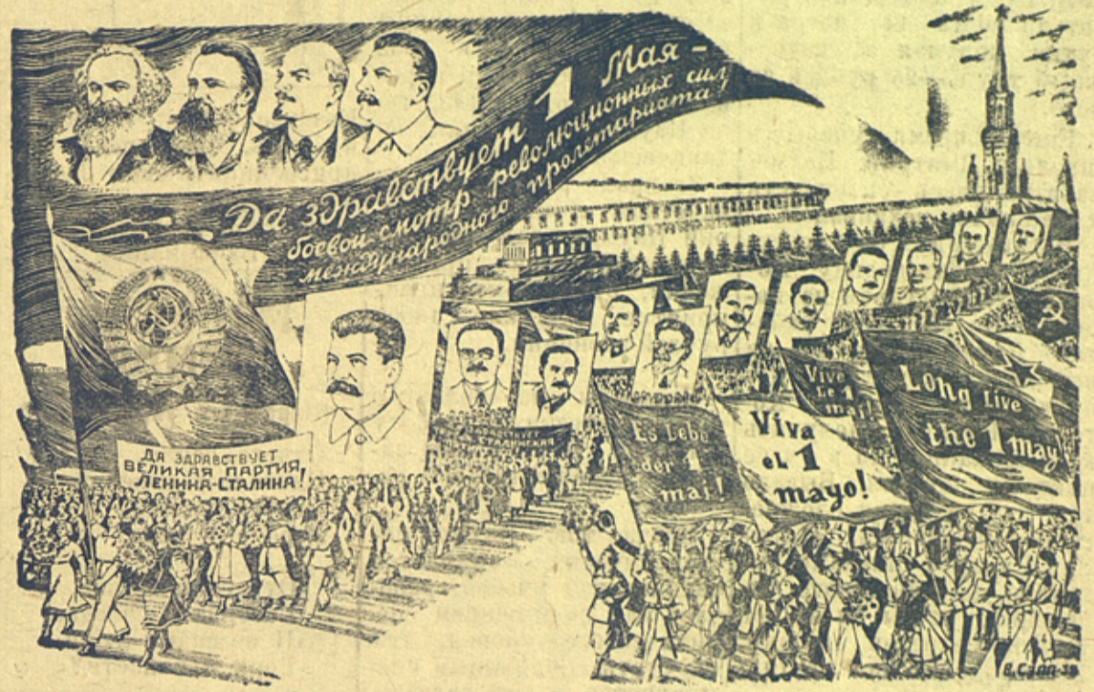
Рисунок художника В. Сэпп.

XVIII съезд большевистской партии утвердил третий пятилетний план развития народного хозяйства СССР. Рабочие, колхозники, советская интеллигенция! Боритесь за выполнение этого плана!