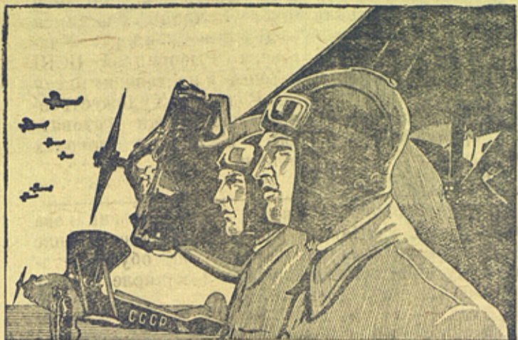
ДА ЗДРАВСТВУЮТ СОВЕТСКИЕ ЛЕТЧИКИ, ГОРДЫЕ СОКОЛЫ НАШЕЙ РОДИНЫ! УЧАСТИЕМ В 13-й ЛОТЕРЕЕ КРЕПИТЕ ОСОАВИАХИМОВСКУЮ АВИАЦИЮ!

Правительство удовлетворило ходатайство рабочих Харьковского завода и разрешило провести с 1 мая по 15 июля 13-ю Всесоюзную лотерею Осоавиахима на общую сумму 135 миллионов рублей.