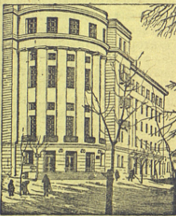
На снимке: новое здание гостиницы „Белоруссия“ в городе Минске (БССР).