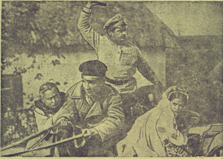
На снимке: кадр из фильма.

Новый художественный звуковой фильм „Союздетфильм“ — „Шел солдат с фронта“. Сценарий писателя орденосца В. Катаева.