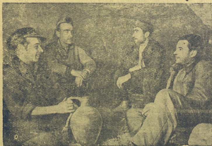
На снимке: Бойцы республиканской армии отдыхают в горном ущелье в перерыве между боями.