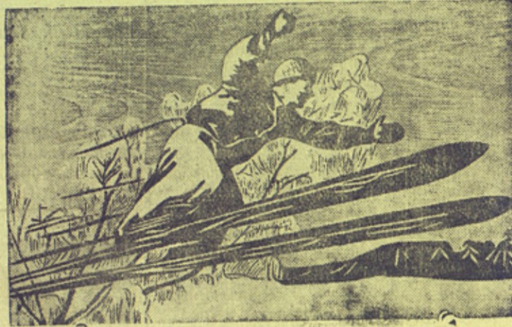
На снимке: „Прыжок лыжника“ — мозаичная работа инструктора профтехшколы П. П. Саечникова.

С 15 по 25 января в г. Семенове, Горьковской области, была открыта районная художественная выставка изобразительного искусства. На выставку представлены работы: хохломская роспись, мозаика, резьба по дереву, детские игрушки, скульптура, картины и другие экспонаты.