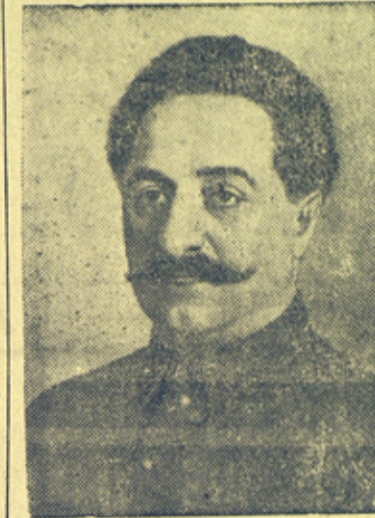
На снимке: Г. К. Орджоникидзе.

ны Серго — бесстрашный полководец. Украина, Дон, Северный Кавказ, Закавказье, Белоруссия — всюду он руководит борьбой с контрреволюцией. Великая роль Серго в сплочении и организации братского содружества народов Кавказа, в освобождении этих народов.