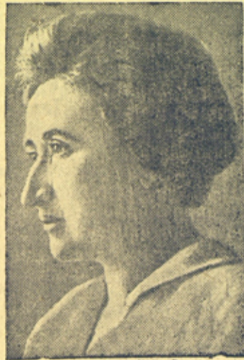
На снимке: Роза Люксембург

бург. И все же, когда началась война, Либкнехт и Люксембург очутились по другую сторону баррикады, чем верхушка социал-демократии, и выступали против войны.