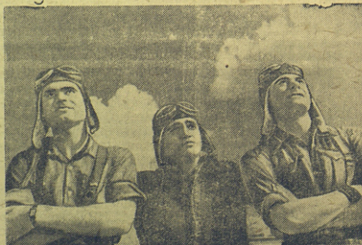
На снимке: Молодые летчики следят за полетом эскадрильи республиканских самолетов.