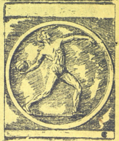
На снимке: барельеф „Вolleyбол“ (из белого глазурованного фарфора), работы Елены Янсон-Манизер, этим барельефом будем оформлена станция „Динамо“.

Архитектурное оформление станции 2-й очереди Московского Метро.