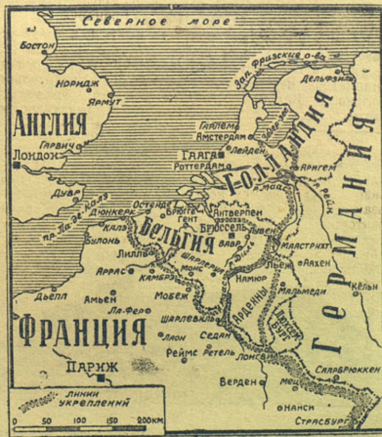
К военным операциям в Западной Европе.

Советский народ бережно хранит высокую память о своем писателе-друге, погибшем от руки троцкистско-бухаринских злодеев. Советский народ ценит литературное наследие Горького, черпая из него вдохновение в борьбе за коммунизм. Э. А.