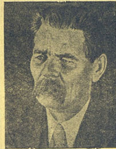
Великий русский писатель Алексей Максимович Горький (1868—1936 г.)

„Песни о Буревестнике“ и „Матери“. Горького мы по праву называем родоначальником социалистической литературы. Под влиянием Горького зарождалась и выросла наша советская литература, самая передовая литература в мире. Горький дал путевку в жизнь