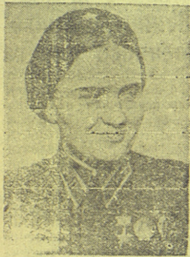
Кандидатом в депутаты Московского областного Совета избрана Герой Советского Союза М. М. Раскова.