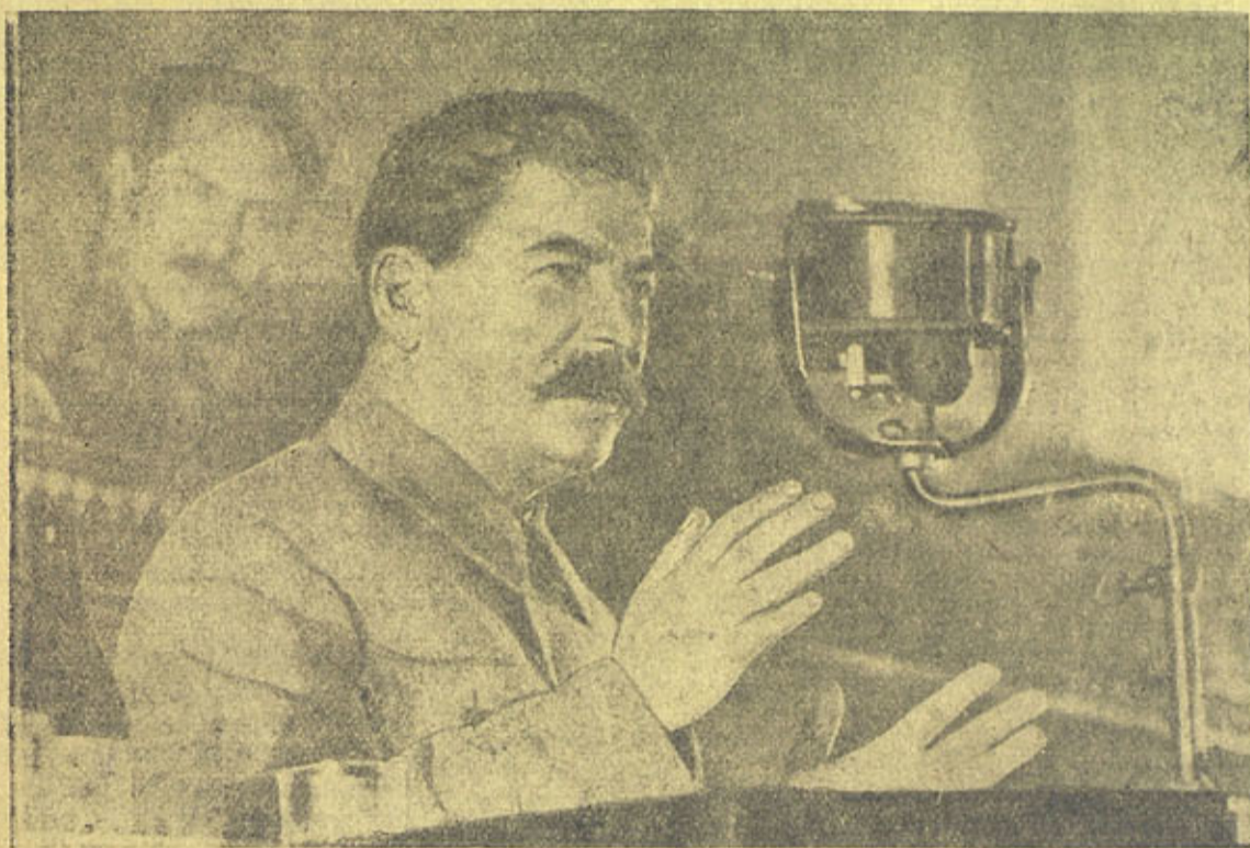
Товарищ И. В. СТАЛИН делает доклад о проекте Конституции СССР на Чрезвычайном VIII Всесоюзном Съезде Советов.

Привет Вам, дорогой товарищ Сталин! Примите народную любовь и благодарность за радостную, культурную, счастливую жизнь, к которой привела нас партия большевиков!