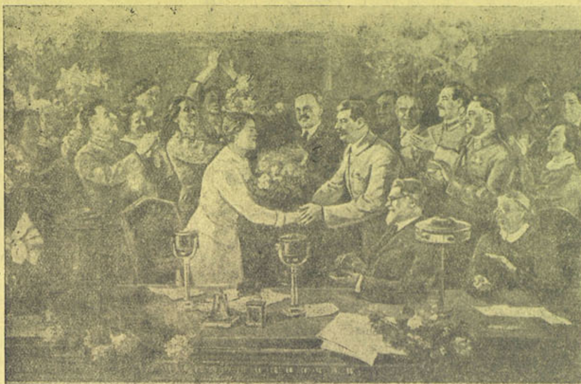
„Незабываемое“. (Руководители партии и правительства в президиуме совещания общест- венниц тяжелой промышленности в Кремле). С картины худ. В. П. Ефанова.

Записано в 1936 году со слов сказителя Павле Геджурашвили в селе Таба-Цхури, Боржомского рай- она, Грузинской ССР.