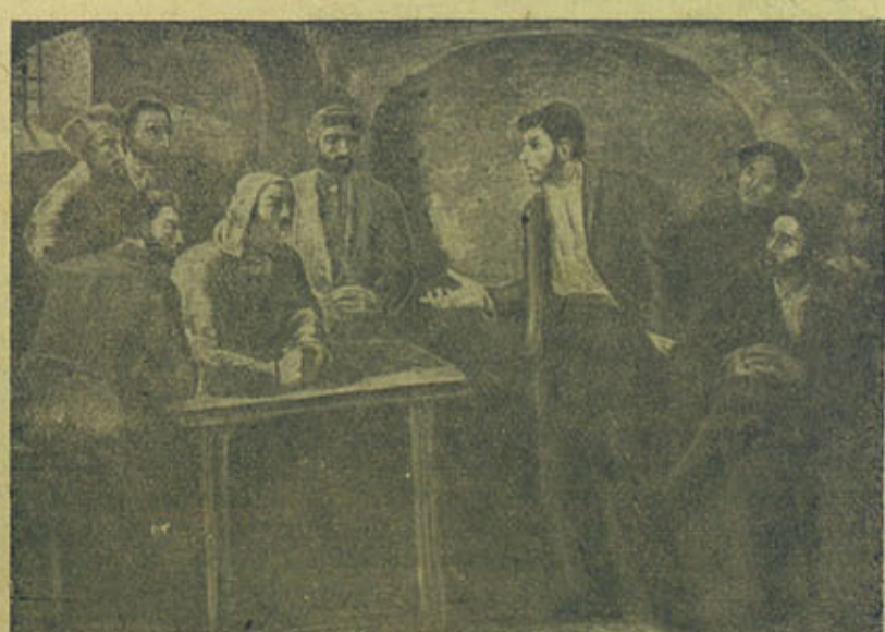
„Товарищ Сталин ведет беседу в Кутаисской тюрьме“. Репродукция с картины художника Бажбеук-Меликова