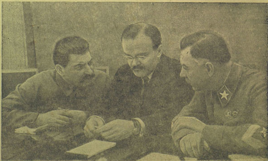
И. В. Сталин, В. М. Молотов и К. Е. Ворошилов (1936 г.)