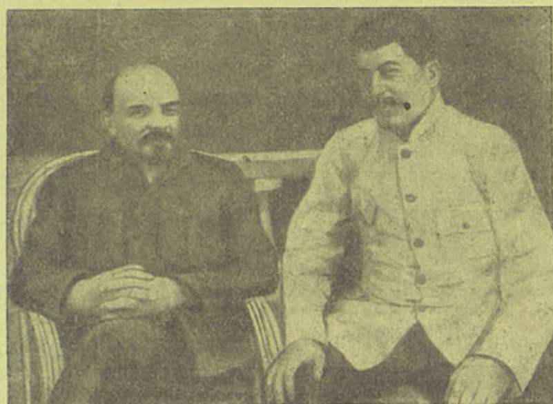
В. И. Ленин и И. В. Сталин в Горках (1922 г.)