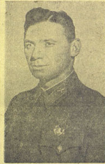
НА СНИМКЕ: комбриг В. К. Коккинаки

Вы все знаете, конечно, что они эти и многие, многие другие герои, наши сталинские соколы, еще о многих качествах нашей авиации делом расскажут нашему народу и всему миру ( продолжительные аплодисменты ).