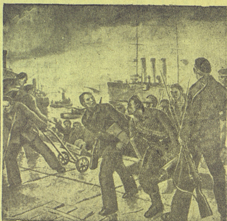
Десант моряков с „Авроры“