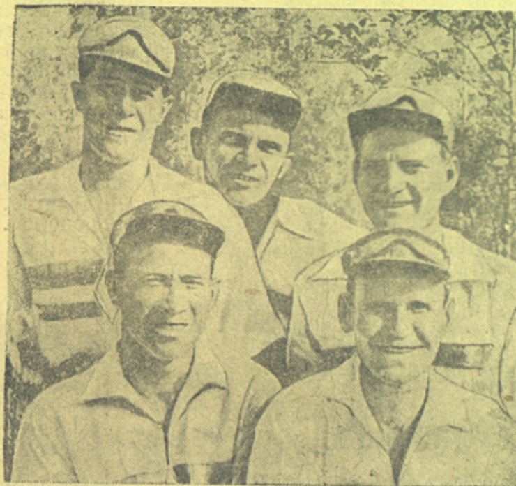
Велопробег участников боев у озера Хасан по маршруту сопка Заозерная—Западная граница СССР.

ПРИМЕЧАНИЕ: колхозы „Новая жизнь“, „Пролетарий“, им. Сталина включены в сводку по данным на 15 июля.