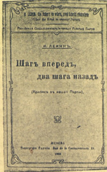
На снимке: Обложка первого издания книги В. И. Ленина „Шаг вперед, два шага назад“, изданной в Женеве в 1904 г.

3) Партия есть не просто организованный отряд, а „высшая форма органи-