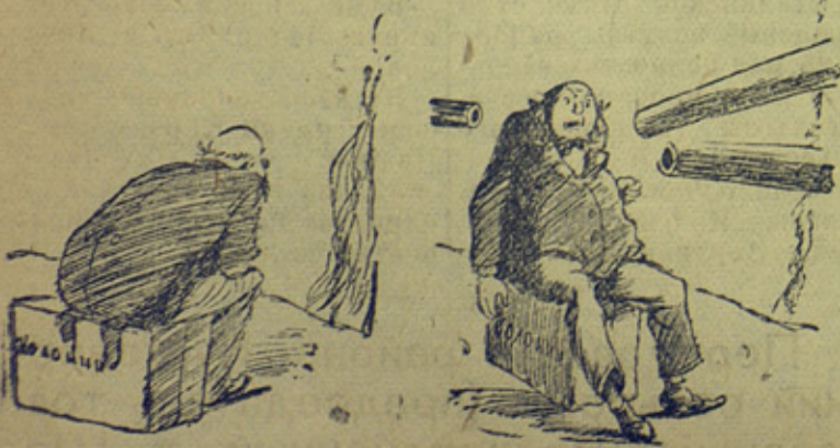
Английский джентльмен: —Моя хата с краю-я ничего не знаю.