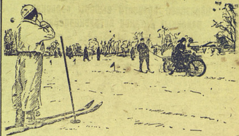
Соревнования на лыжах с мотоциклом. Перерисовка с Фото/Союзфото.