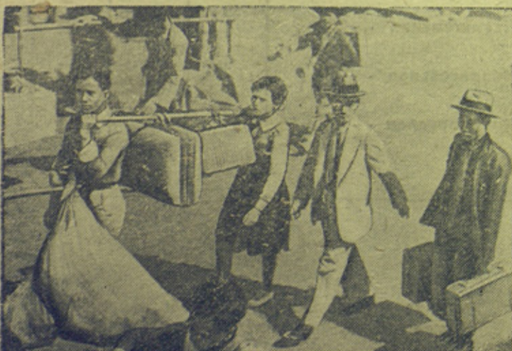
На снимке: Беженцы покидают город, находящийся под угрозой захвата агрессором.

Японские интервенты при захвате китайских городов, зверски расправляются с мирными жителями. При приближении врага китайское население покидает свои жилища, спасаясь бегством.