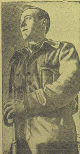
На снимке: Молодой боец республиканской армии на посту (Фронт Эбро).