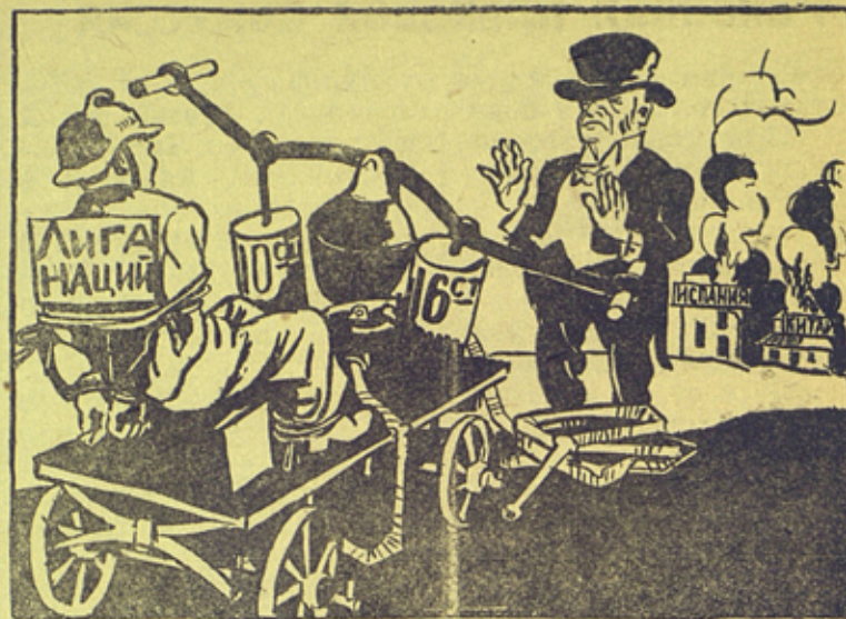
Рис. „Афилова „Пресеклише“.