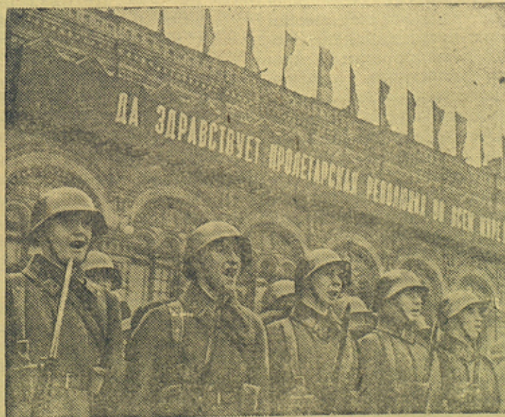
На снимке: Бойцы Н-ской части приветствуют народного комиссара Обороны СССР маршала Советского Союза К. Е. Ворошилова.