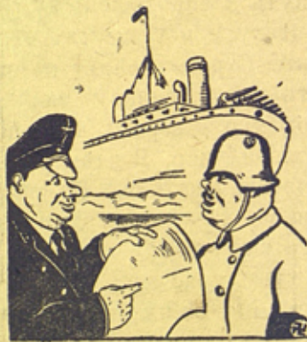
Рис. худ. Грузина (Пресеклише).

— Кто говорит, что мы снабжаем Франко? Мы снабжаем исключительно своих немецких солдат.