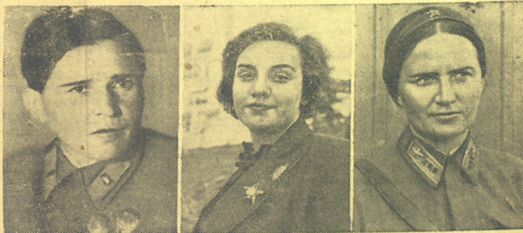
На сн. (слева-направо): П-й пилот самолета „Родина“, капитан-орденоносец П. Д. Осипенко, командир экипажа, депутат Верховного Совета СССР, орденосеца В. С. Гризодубова, штурман самолета „Родина“, старший лейтенант-орденосеца М. М. Раскова.

24 сентября 1938 г. в 8 час. 12 минут утра по московскому времени известные всей стране летчицы-орденоносцы Гризодубова Валентина Степановна, капитан Осипенко Полина Денисовна и старший лейтенант Раскова Марина Михайловна (штурман) вылетели в беспосадочный перелет из Москвы на Дальний Восток на двухмоторном самолете „Родина“. Героические летчицы блестяще завершили свой перелет.