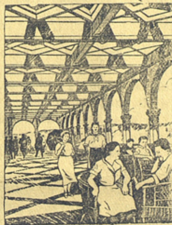
На рис.: На террасе третьего этажа верхней станции фуникулера.