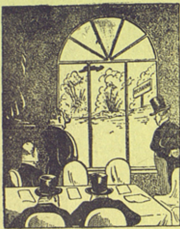
Рис. В. Лисевич и Калмыкова

— Работу комитета по невмешательству придется отложить пока не утихнет этот шум, мешающий работать.