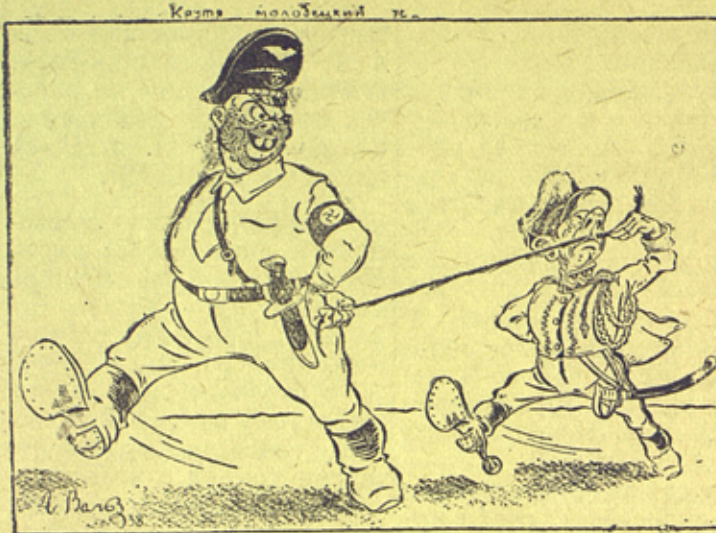
Рис. Г. Вальк „Пресскапше“.

... или „независимая“ польская политика.