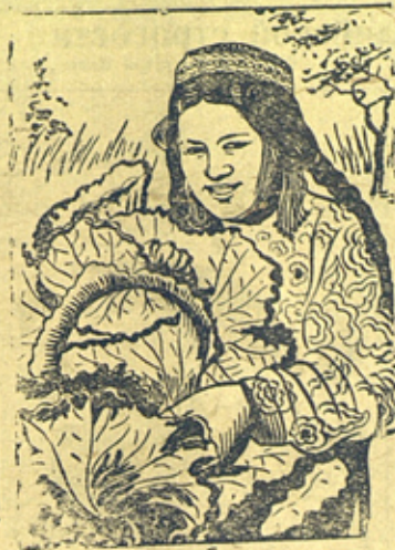
Юная колхозница колхоза им. Маркса (Горно-Бадахшанская автономная обл.) с выращенной капустой на колхозном огороде.