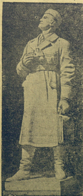
На снимке „Командир—пилот“ — скульптура Г. Л. Петровшевич

Выставка XX лет РККА и Военно-Морского флота